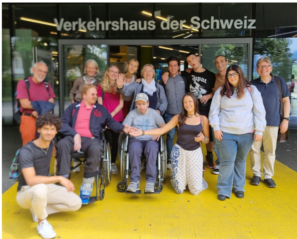
Settimana di vacanza a Lucerna, luglio 2025

Grazie per un altro splendido anno con voi!