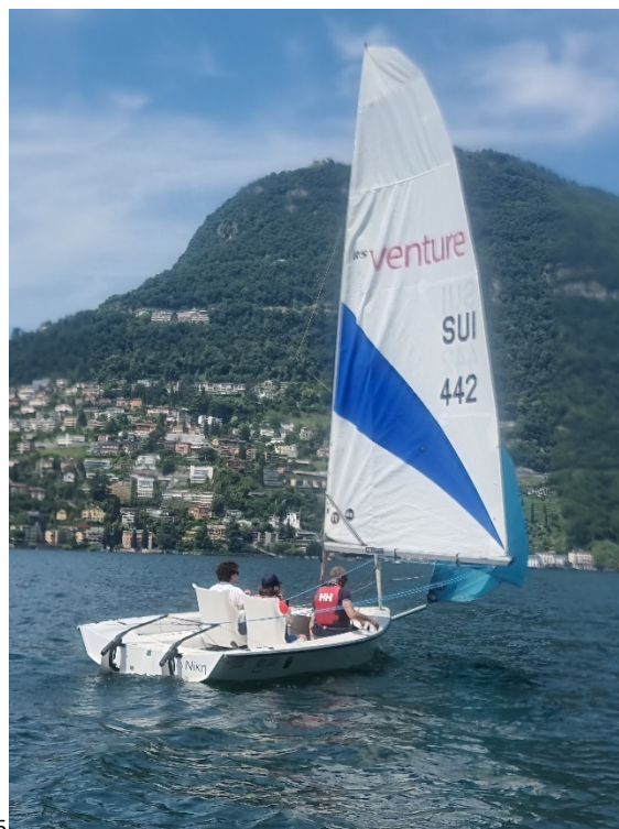
Giro in barca vela con "I Velabili", maggio 2025