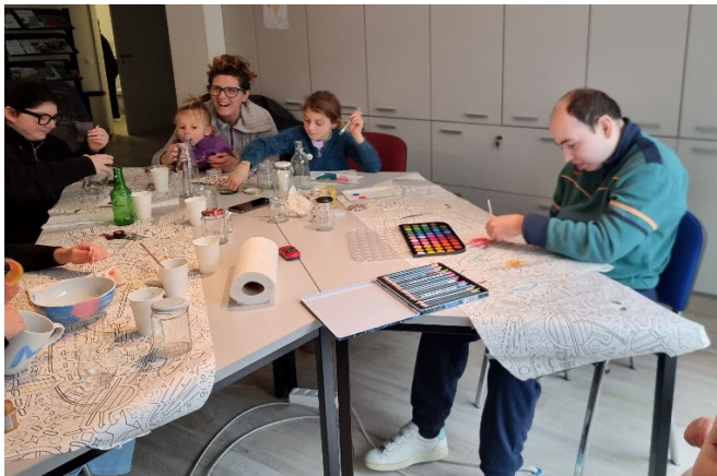
Atelier di pittura, gennaio 2025