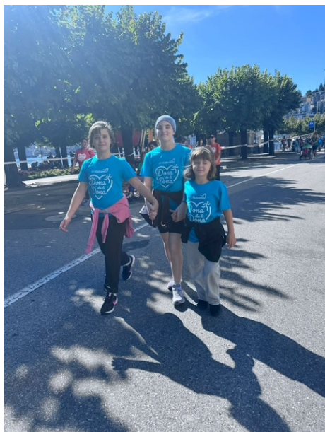
StraLugano, settembre 2025