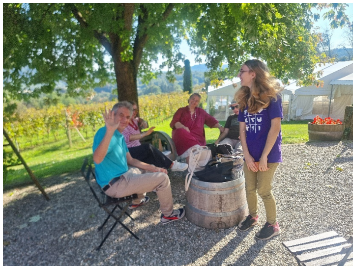
Vendemmia, settembre 2025