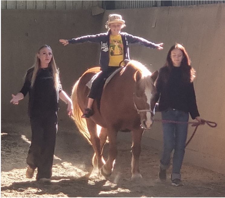
Scuderia, ottobre 2025