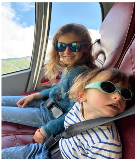
Telethon Vola, maggio 2025